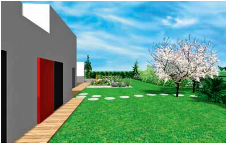
Pohled přes zahradu od chodníku spojujícího branku s dřevěnou terasou u domu

lemován keři a na dvou místech, za skalkou a ve výhledu na západní stranu, jsou vysázeny bambusy. Výběr druhů bambusů, které by se daly použít v sušší oblasti, je poněkud omezen – dá se například použít výběžkatý druh Bashania qingchengshanensis , vhodný pro stálezelené clony, který ale musí být vysázen v kořenové bariéře. Všechny druhy bambusů pro dobrý start a pozdější zdravý růst vyžadují v prvních dvou letech po výsadbě pravidelnou závlahu, za zvážení by proto stál automatický systém závlahy. Zbývající místa podél obvodu doplňují kvetoucí, případně stálezelené keře. Kompostéry jsou umístěny na obou protilehlých koncích zahrady kvůli lepší dostupnosti. ✖