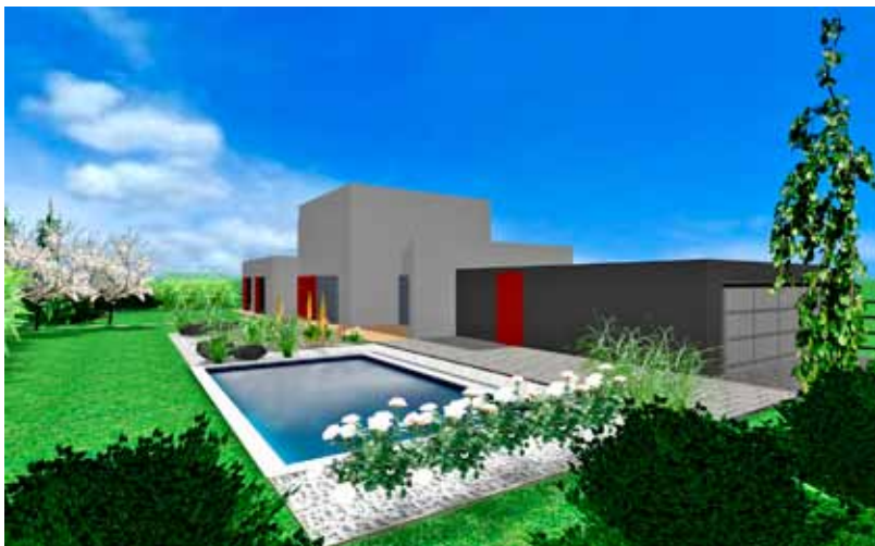
Pohled přes zahradu od bílých růží za bazénem