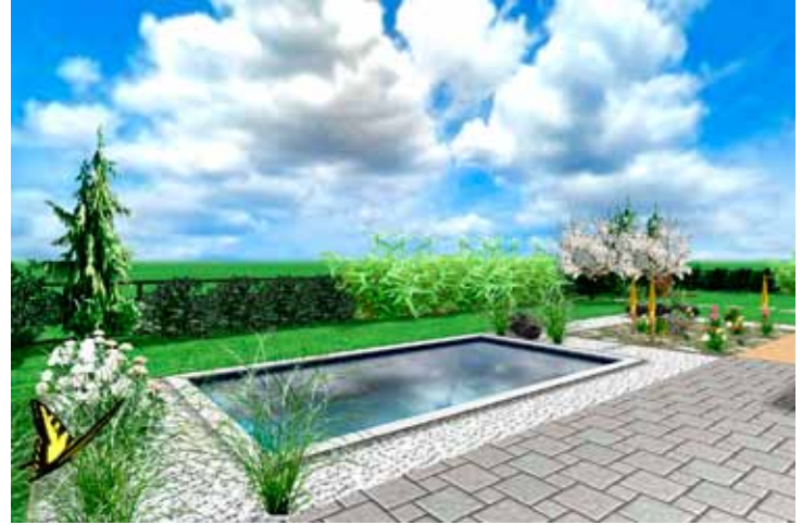
Bazén zakončený exotickou výsadbou ve skalce a řadou bambusů u plotu