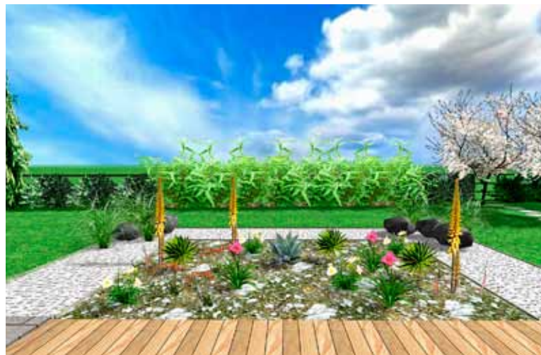
Suchá skalka s agáve před terasou