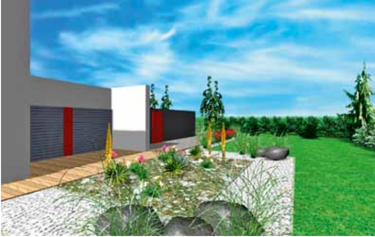
Pohled od suché skalky ke garáži, před ní záhon s červenými růžemi. Varianta bez bazénu a s ovocnými stromy u garáže